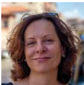
Annette Schymalla, Bezirksbeauftragte für Friedrichshain- Kreuzberg, Neukölln und Treptow-Köpenick

D ie Dienste und Projekte der Caritas richten sich an Menschen, die in Schwierigkeiten geraten sind, die aus dem System gefallen oder neu in Deutschland sind. Menschen, die Unterstützung brauchen, in ihre eigene Kraft zu kommen und Lösungen für ihre Probleme zu finden.